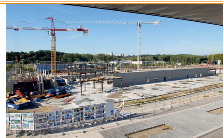
L'Heure Tranquille : des commerces variés pour les résidents et les visiteurs.

Venez écouter les professionnels du bâtiment vous parler de leurs métiers avec passion sur ce chantier d'exception.