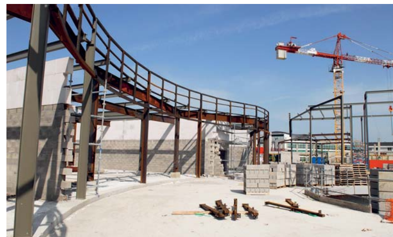
En construction : la place centrale et la coursive qui surplombe les restaurants.

Dans le même esprit, le choix a été fait d'un vaste parking souterrain qui fait l'objet d'un travail particulièrement attentif de la lumière et qui sera relié à l'Heure Tranquille par des tapis roulants (travelators). Ce parking public desservira aussi les 12 000 m 2 de bureaux en construction de part et d'autre de l'entrée principale de L'Heure Tranquille et qui participent à la bonne tenue