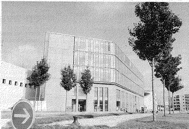
Les bureaux des Lions d'Azur, sur 12.000 m 2 , sont quasiment terminés sur l'entrée Est de l'espace commercial. Une architecture signée du parisien Daniel Kahane, Grand prix de Rome.