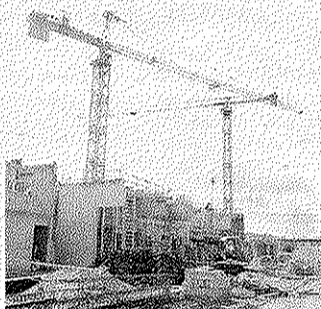
Les grues sont encore là pour plusieurs mois.