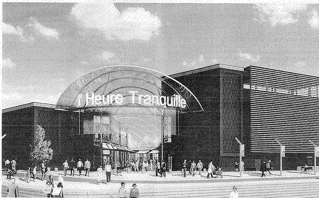
Le choix d'une voûte translucide a été retenu pour protéger la galerie marchande.

L'Heure Tranquille, hésitait entre une structure béton ou métallique (finalement retenue). Le grand changement tient au choix d'une voûte translucide, qui protégera la galerie de la pluie. « Ça correspond au fun shopping, à la modernité que l'on attend d'un tel endroit », indique l'élu. Le matériau, peu utilisé en France, est maintenant en fabrication. Il répond aux normes de sécurité et le feu vert des architectes a été donné, la structure pouvant supporter son poids.