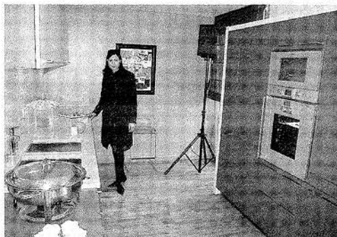
... tandis qu'à l'intérieur de l'appartement témoin, on pourrait déjà faire la cuisine.